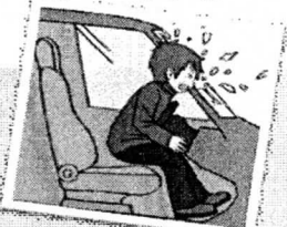
ガラスを突き破る