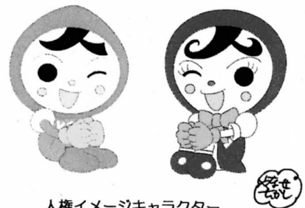
人権イメージキャラクター