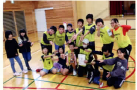
ドッジボール(高学年):優勝