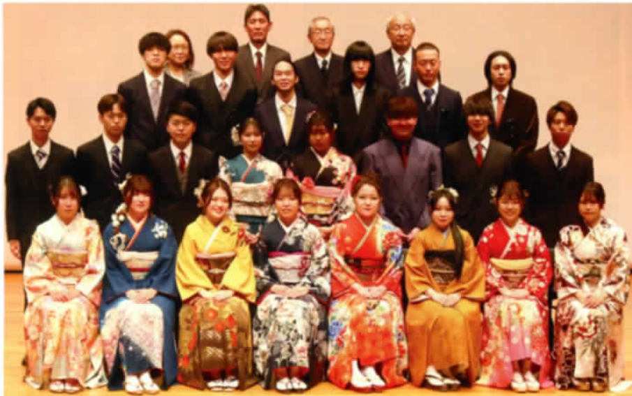
石渡地区での記念撮影