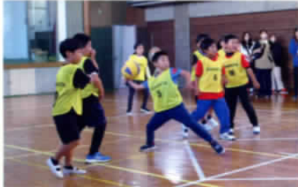
ドッジボール(低学年):3位