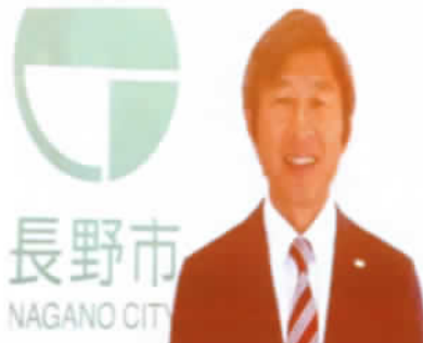
荻原市長からのビデオメッセージ