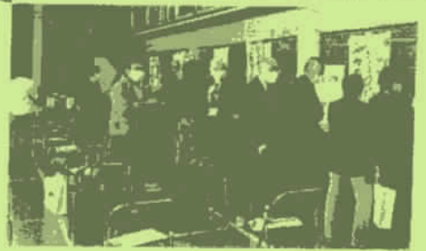
大勢の皆さんが熱心に説明を受けていました。