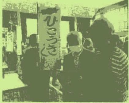
各団体ごとに活動について説明をしている様子

居場所って!? コーヒーが飲める! 自由に歌える! おしゃべりができる! ゆっくりできるとこ