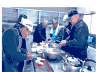
男性の地域デビュー促進事業

未就園児やその保護者等を対象に、お互いの交流や保健師による育児のアドバイスなどをおこなっています。