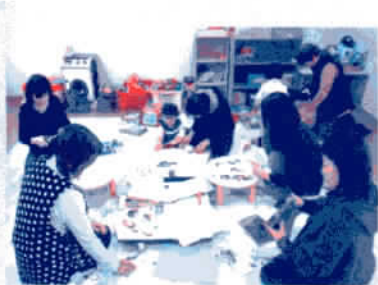
子育て・子育て支援事業

身体的な理由により、公共交通機関の利用が難しい高齢者や障害者等の、通院時の移送支援をおこなっています。