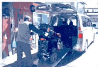
福祉自動車運行事業

地域の方が気軽に集まり交流します。お互いに笑顔になれるだけでなく、孤立防止にも役立っています。