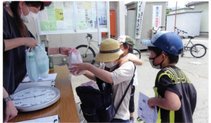
ゴールしました おみやげを貰ってにっこり