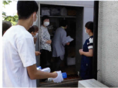
役員で協力し片付ける様子

使えない物は処分し、それ以外の物は丁寧に確認をしてから所定の位置に保管し直しました。それらは次の出番が来るのを静かに待ち続けることになりました。