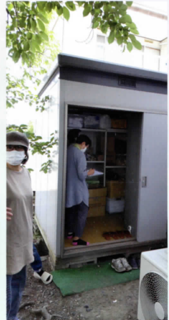
物置もスッキリしました