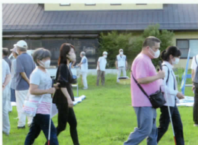
6時過ぎ 次々と集まりました