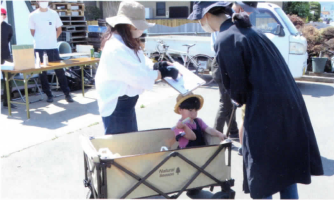
次はどこ行こうか?

は疲れたけど、いっぱい歩いてクイズもできて楽しく楽しかったのでまたやりたいです。」 お昼前にはぞくぞくと公民館にゴールし、頭を使い体も使いながらのウォークラリーに満足そうな笑顔がたくさん見られました。