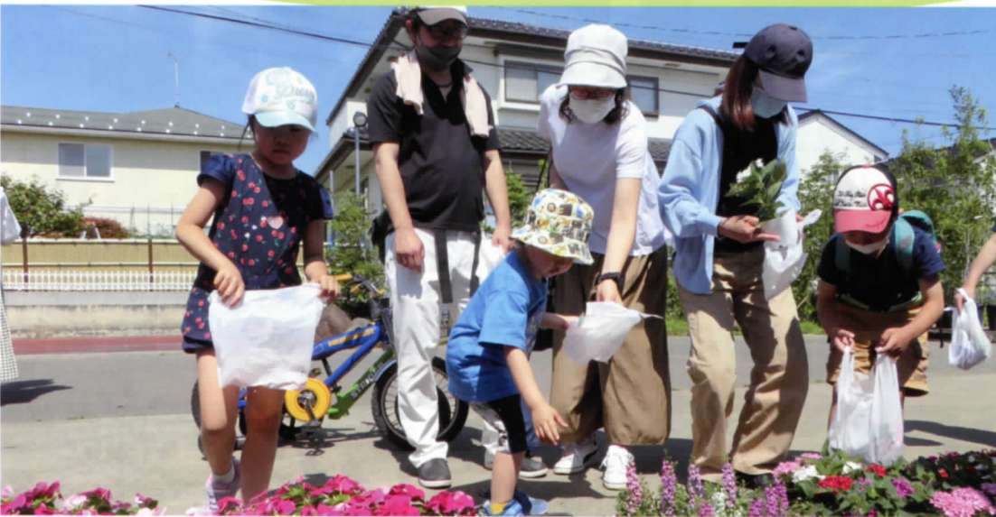
ころぼっくるからお花のプレゼント どれにしようかなあ