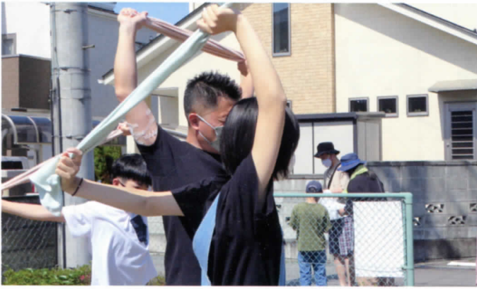
タオルで上半身のストレッチ