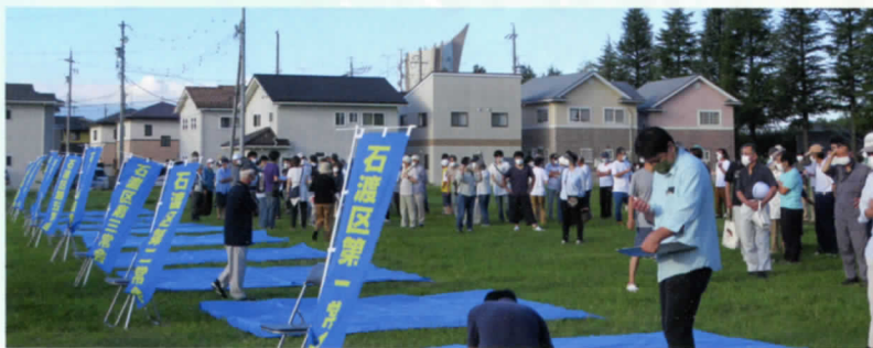
常会ごとにまとまります