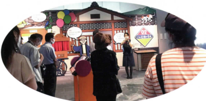
ゲーム感覚で学べます

7月14日(木)、石渡区初めての試みとして長野市松岡のながの環境エネルギーセンター見学会が行われました。参加者は1常会から4常会の環境美化指導員、常会長、隣組長の23名。