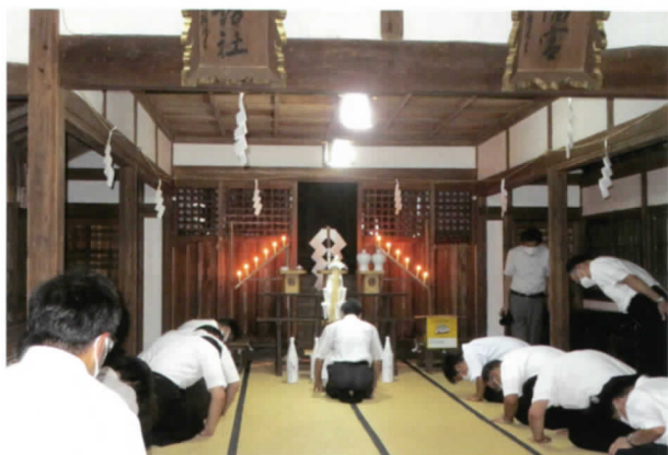
平穏無事・無病息災・五穀豊穡を祈ります