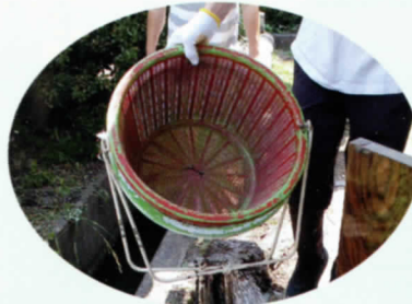
床下には色んなものが収納されていました