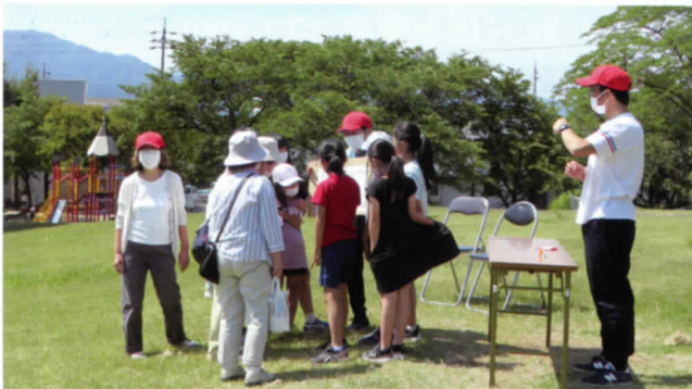
サブトラック西側 丘の上はとってもにぎやか