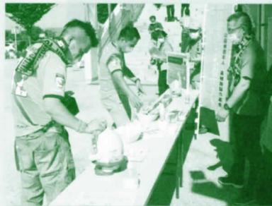
スポーツイベント会場での募金活動